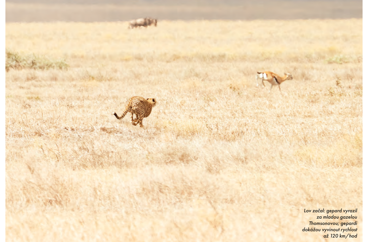
Lov začal: gepard vyrázil za mladou gazelou Thomsonovou; gepardi dokážou vyvinout rychlost až 120 km/hod

Několik následujících hodin trávíme stopováním matky, která se vydala na lov. Jelikož ale nebyla dostatečně opatrná, vytipovaná kořist ji zahlédla a utekla. Co nevidět se savana proměnila v obrovské mokré pole, což gepardi samici náramně vyhovuje, jelikož jí to poskytuje dokonalé maskování. Každá gazela se ale pořád zdá být na pozoru. Předtím než se jí naskytla opravdová příležitost, musela uběhnout několik kilometrů. Přikrčila se ve vysoké trávě a čekala, až se k ní dvě gazely samy přiblíží. Nevšimavě kolem ní procházejí, ale ani se nehně. Právě ve chvíli, kdy jsem si říkala, že promrhala svou šanci, vyskočí z trávy a se silou rýtčího se vlaku má do dvaceti sekund jednu z gazel v pazourech. Matka s mládětem se pak u úlovku střídají, přičemž ten druhý pozorně sleduje, jestli v okolí nejsou nějaké nevídané mrchožrouti. „Pozornost nemůžou povolit ani na sekundu,“ říká Charles, když se nedaleko od gepardů na zem snesou dva supi. „Hyenám nebude trvat dlouho, až je ucítí. Viděly supy, jak krouží nad ulovenou gazelou, a budou je následovat.“ ➡