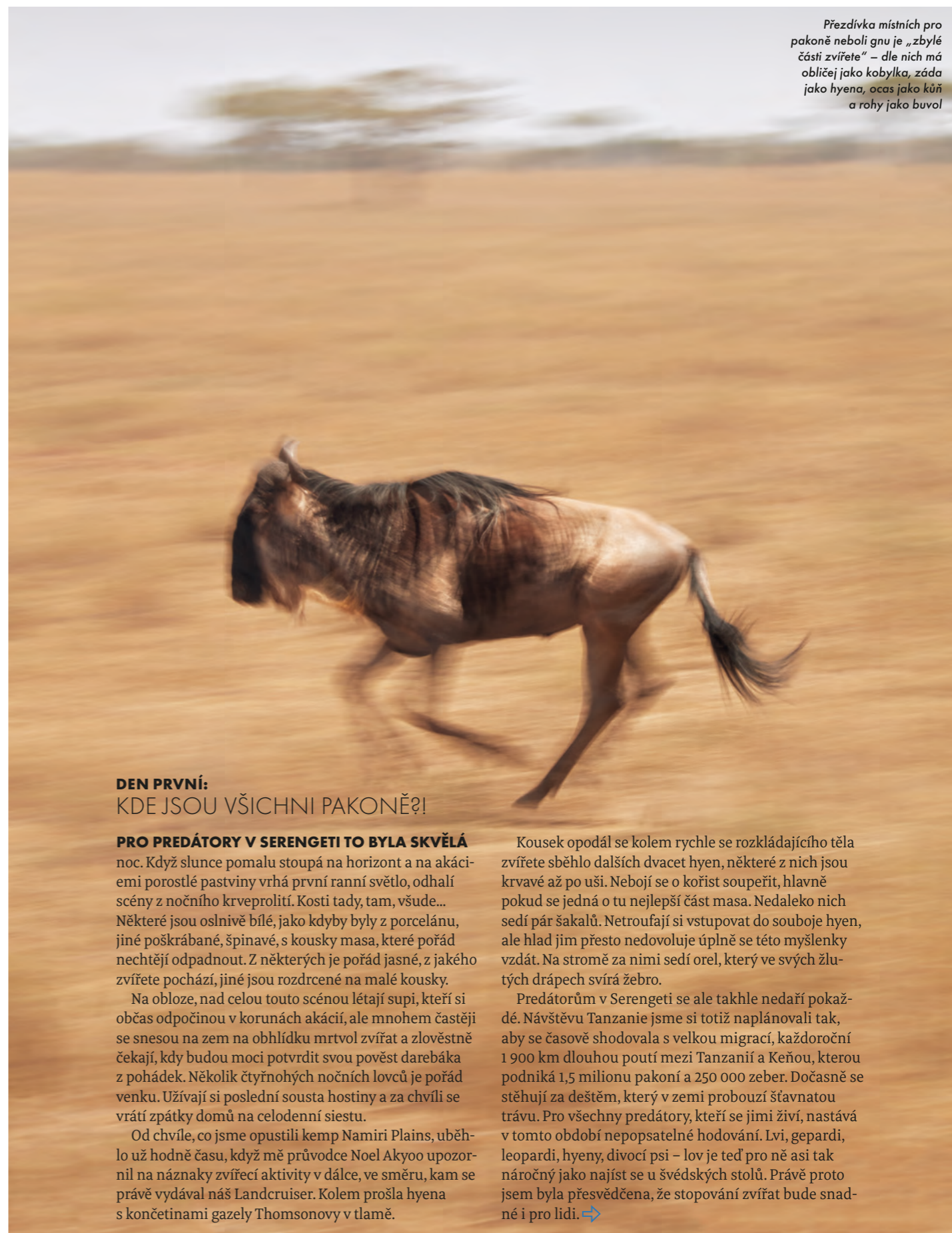
Přezdívka místních pro pakoně neboli gnu je „zbylé části zvířete“ – dle nich má obličej jako kobylka, záda jako hyena, ocas jako kůň a rohy jako buvol