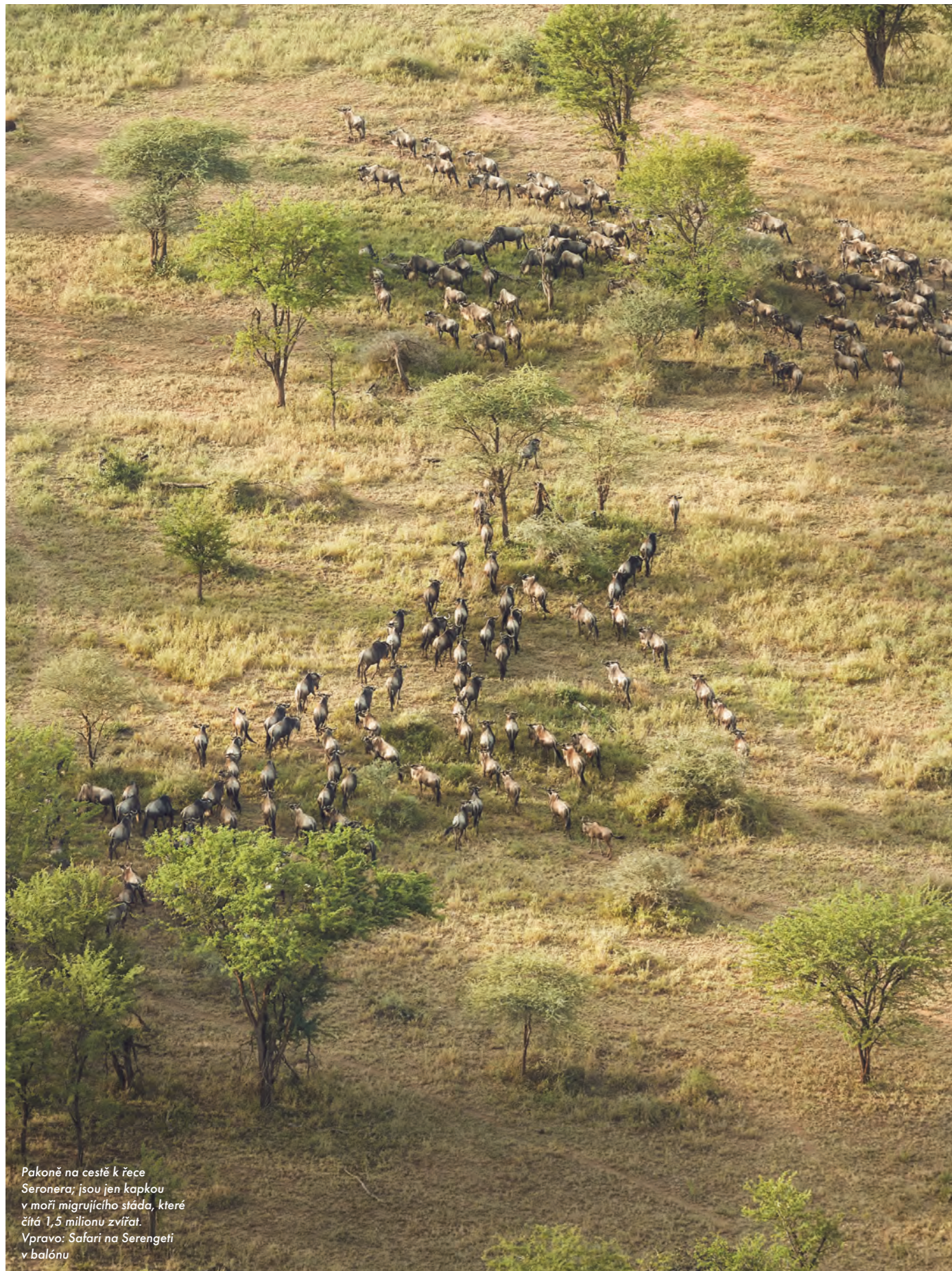
Pakoně na cestě k řece Seronera; jsou jen kapkou v moři migrujícího stáda, které čítá 1,5 milionu zvířat. Vpravo: Safari na Serengeti v balónu